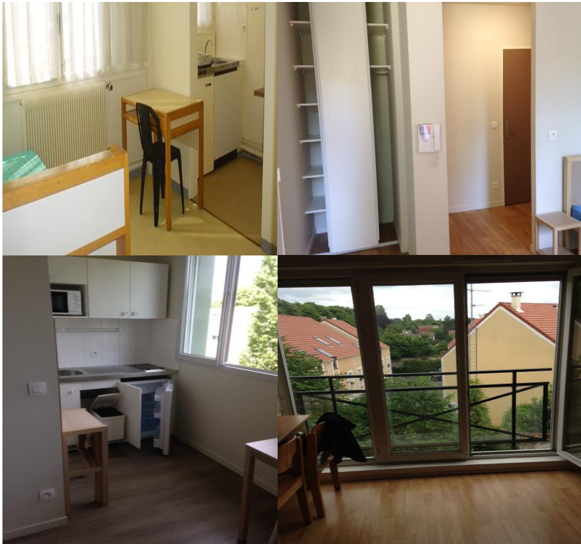
Exemples de logements proposés

La location meublée doit porter sur un logement muni de tout le mobilier nécessaire à l'habitation. Cette modalité de location est encadrée par la loi Alur de mars 2014. Ces logements permettent à de jeunes actifs âgés de 18 à 30 ans (voire au-delà) de louer des studios et des T2 meublés en région parisienne. Le montant mensuel des loyers s'élève de 450 à 600 € toutes charges comprises (eau, chauffage, ...).