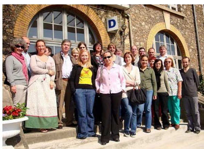
Les élus du SNES au Rectorat lors de l'intra 2010

Les élections professionnelles de 2008 ont confirmé son poids de syndicat majoritaire en lycée et collège (plus de 54% des voix dans l'académie), ce qui lui assure la majorité des sièges dans les commissions administratives paritaires académiques (CAPA) compétentes sur la carrière et le mouvement des personnels enseignants. Cela impose au SNES des responsabilités particulières.