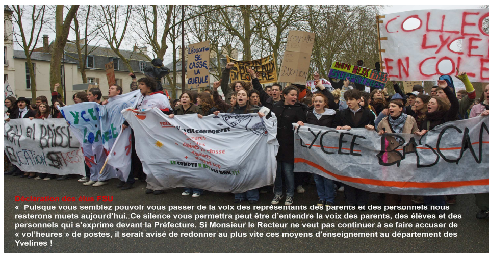
Département des Yvelines (2011)

C'est pourquoi les élus du SNES agissent toujours en tant que représentants de l'ensemble de la profession et ont toujours le souci d'exiger, en face d'une Administration qui se complait de plus en plus dans l'arbitraire et l'opacité, la transparence et l'équité de traitement pour chacun et pour tous. Les CAPA sont aussi le lieu où nos élus portent les revendications du SNES en matière de carrière, de gestion et de règles du mouvement, n'hésitant pas à s'opposer à l'Administration, ce qui peut, par blocage de cette dernière, provoquer des conflits importants (notamment lors du mouvement intra ou de la hors classe).