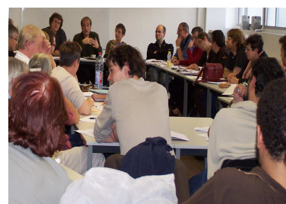
Réunion sur la réforme des lycées à la section académique

Attaché à la démocratisation du système éducatif, soucieux de la réussite de tous les élèves sur tout le territoire en particulier dans les zones d'éducation prioritaire, le SNES combat toutes les réformes qui se sont mises en place depuis 2005 (Loi Fillon en collège, réforme actuelle du lycée, création des établissements CLAIR...) qui ont pour logique le tri social et aboutissent au renforcement des inégalités sociales (assouplissement de la carte scolaire) et à la stigmatisation des élèves issus de milieux défavorisés et de leurs familles.