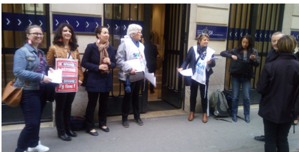
ONISEP et CIO, unis pour tracter devant le MEN

Ces arguments sont entendus par les jeunes et les parents puisqu'à l'initiative du SNES et de la FCPE une déclaration commune faite au CSE a été soutenue par les autres organisations syndicales, les lycéens et les étudiants ( https://www.snes.edu/CSE-du-15-mai-Une-declaration-unitaire.html ).